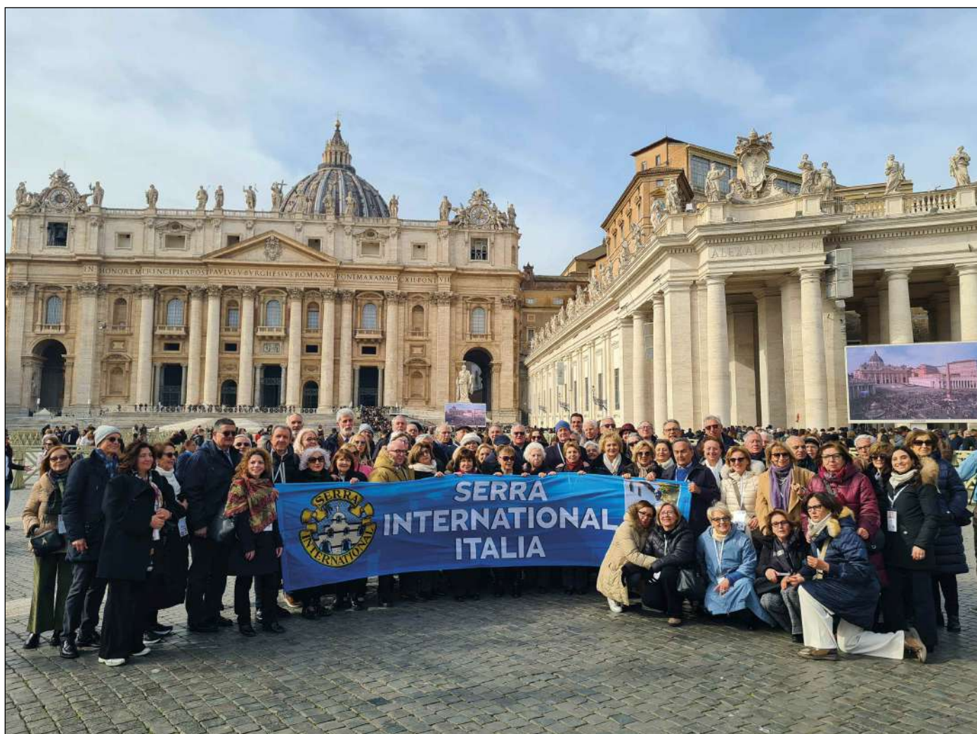
Vaticano, Piazza San Pietro, 2 febbraio 2025. Al termine dell'Angelus con papa Francesco

Il nostro percorso giubilare ha trovato il suggello sempre nelle parole del cardinale Stella: “Signore aiutaci ad accompagnare i nostri sacerdoti affinché possano illuminare con saggezza evangelica il quotidiano della loro vita. Signore Gesù, nella tua luce, aiutaci a divenire profeti della tua luce, qui ed ora, ricordandoci che noi siamo, qui ed ora, l’ adesso di Dio!”.