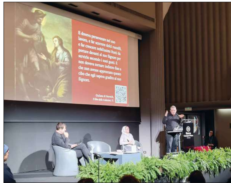
Roma, Auditorium "TH Carpegna", 5 gennaio 2025. I lavori del Convegno