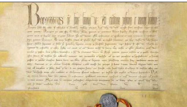
La bolla del primo Giubileo del 1300

di Mimmo Muolo Avvenire, 24 dicembre 2024