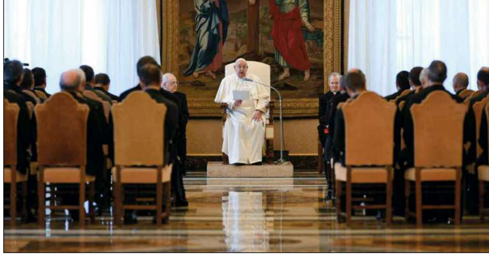
Vaticano, Palazzo Apostolico, 25 gennaio 2025. Papa Francesco incontra i rettori dei Seminari Maggiori e propedeutici di Francia

dovrebbe cercare di formare cloni che la pensino tutti allo stesso modo, con gli stessi gusti e le stesse opzioni". La grazia del sacramento, ha affermato il Papa, "mette radici in tutto ciò che arricchisce la personalità unica di ciascuno, personalità che deve essere rispettata, per produrre frutti di vari sapori, dei quali la stessa varietà del Popolo di Dio ha bisogno".