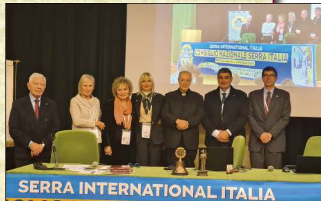
La Commissione giudicatrice

A tutti i partecipanti, oltre i primi sei premiati, è stata rilasciata la Menzione di Merito e, per tre di essi, la Menzione d'Onore.