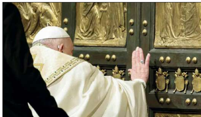
Vaticano, Basilica San Pietro, 24 dicembre 2024. Papa Francesco apre la Porta Santa

All'omelia il Papa è tornato sul tema portante del Giubileo. «La speranza – ha detto infatti – non tollera l'indolenza del sedentario e la pigrizia di chi si è sistema-