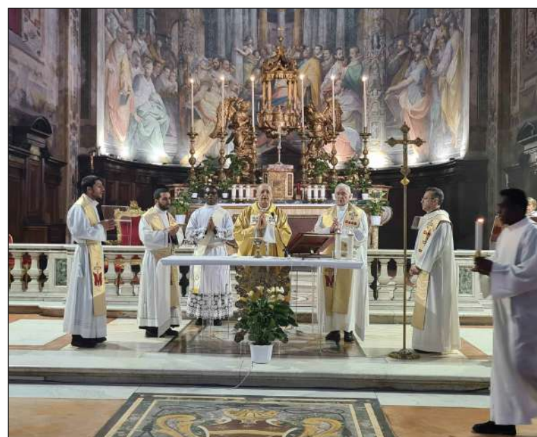
Roma, Chiesa Santo Spirito in Sassia, 1 febbraio 2025. La Celebrazione Eucaristica presieduta da S.E.R. sig. Card. Beniamino Stella

guardava dalla navata destra ma noi avevamo nel cuore un'altra Bellezza. "Sarà così, dietro la Croce, entrare in Paradiso?" ha mormorato una voce. Dalle vetrate la luce pomeridiana illuminava il fluire dei pellegrini. All'altare di San Pietro ci siamo fermati a rinnovare la nostra professione di fede e a ricevere la benedizione. Il primo passo di un nuovo cammino era lì, nella richiesta di perdono e di misericordia.