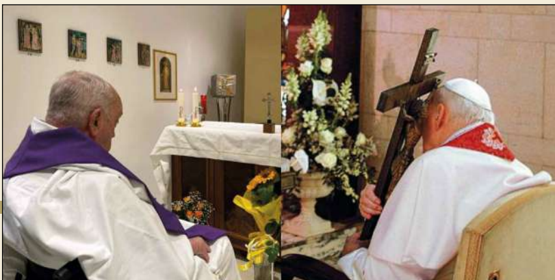
Papa Francesco e papa Giovanni Paolo II

Perché l'Amore avrà sempre le radici più profonde. Perché, come ci ha insegnato quel Venerdì Santo di vent'anni fa, abbracciare la croce è il solo modo per vincerla e giungere alla luce della risurrezione.