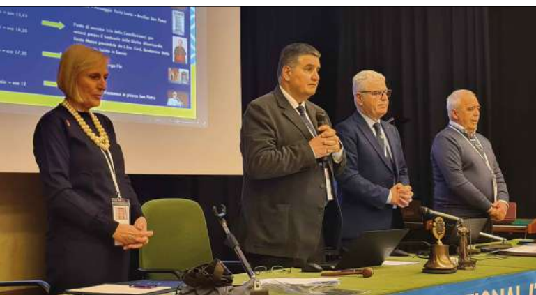
Roma, Auditorium "Casa tra noi", 1 febbraio 2025. Alcuni momenti dei lavori del CNIS di Roma