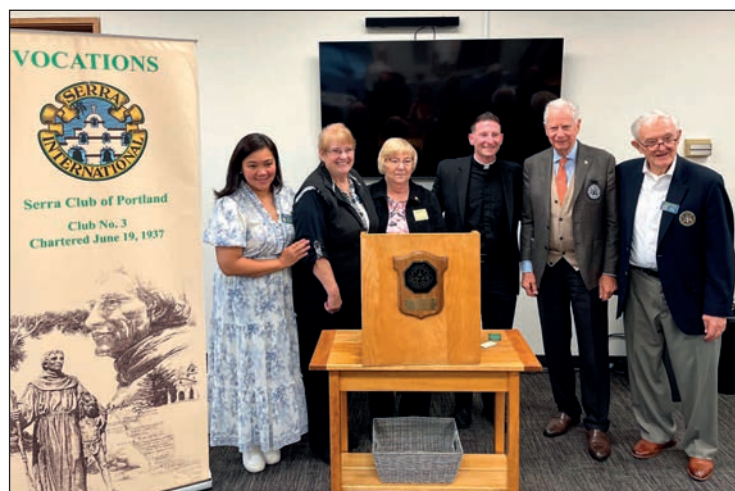
Visita al Club di Portland, USA

E poi, il secondo viaggio con meta ad Aparecida, in Brasile, dove si erge il più grande santuario mariano al mondo, in occasione del congresso annuale del Serra