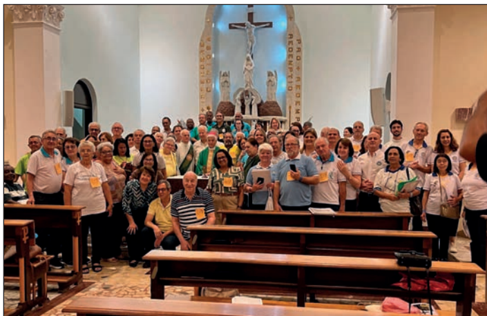
Aa Aparecida, in Brasile

tura della vocazione i giovani allievi nelle scuole militari”.