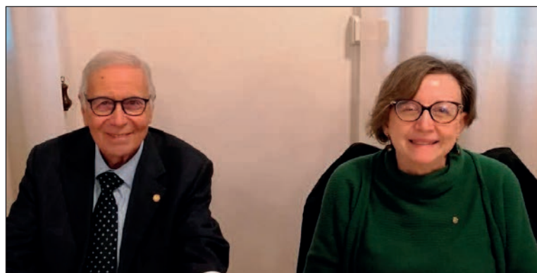
Viterbo, 22 novembre 2025. Il cinquantennale del club