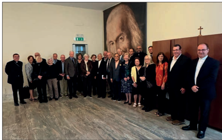
Il Board di S.I. in visita al Dicastero del Clero

come avvicinarli e di come comprendere il loro linguaggio e le loro ansie”. Infatti, “i messaggi da trasmettere, nella sostanza il Vangelo, sono sempre gli stessi ma vanno consegnati in modo da renderli attraenti e di loro interesse”. Sì, non ci pensa due volte: “Questa è la vera sfida!”. In linea con quanto si era proposto il Sinodo dei Giovani, aggiunge: “I giovani vanno ascoltati e accompagnati nel loro cammino esistenziale verso la maturità, affinché possano scoprire il loro progetto di vita” .