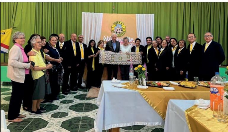
Con i Serra Club di Caacupé, Ypacarai e Villarica, in Paraguay