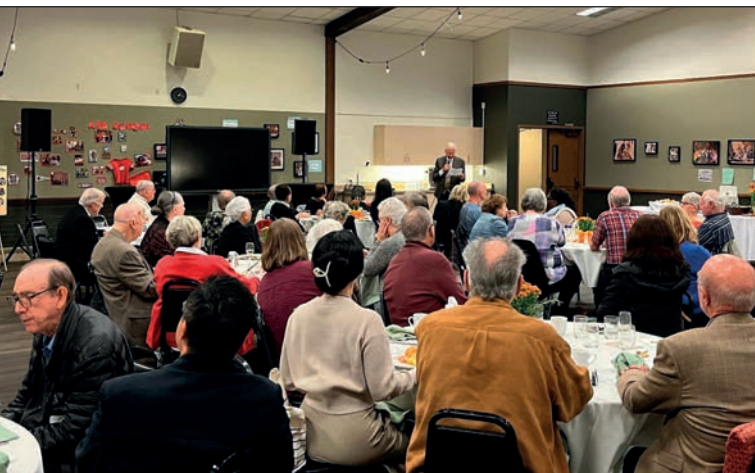
90° anniversario del primo Serra Club, a Seattle

Vorremmo e avremmo ancora tanto da dirci, ma tempus fugit! Il rintocco delle campane della Basilica di San Pietro, che finora aveva scandito i nostri pensieri, ci ricorda altri impegni. Il cammino fatto insieme in questa calda mattinata si interrompe, per farci percorrere strade diverse: metafora di un cammino del tutto grato, sempre nuovo, da percorrere «fino agli estremi confini della terra» (At 1,8).