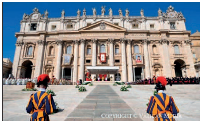
Città del Vaticano, Piazza San Pietro, 7 settembre 2025. La celebrazione di canonizzazione dei nuovi Santi

Una presenza nutrita, colorata, effervescente. Tanto viva che ha saputo fare spazio al più tombale dei silenzi nel momento in cui, alle ore 10.25, il Santo Padre ha recitato, in lingua latina, la Canonizationis formula : «Ad onore della Santissima Trinità, per l’esaltazione della fede cattolica e l’incremento della vita cristiana, con l’autorità di nostro Signore Gesù Cristo, dei Santi Apostoli Pietro e Paolo e Nostra, dopo aver lungamente riflettuto, invocato più volte l’aiuto divino e ascoltato il parere di molti Nostri Fratelli nell’Episcopato, dichiariamo e definiamo Santi i Beati Pier Giorgio Frassati e Carlo Acutis e li iscriviamo nell’Albo dei Santi, stabilendo che in tutta la Chiesa essi siano devotamente onorati tra i Santi. Nel nome del Padre e del Figlio e dello Spirito Santo. Amen. Amen. Amen».