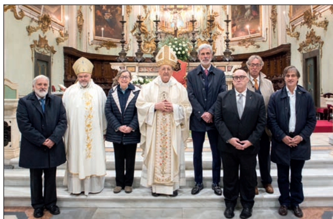
Pontremoli, 15 novembre 2025. Durante la celebrazione del trentennale

S.E.R. il Cardinale Beniamino Stella nel suo intervento ha sottolineato come il Serra sia una famiglia in cui si vive la vita cristiana e si testimonia con la propria esistenza la fede in Cristo nella quotidianità. Ha ribadito che i cristiani devono essere “credibili” e, ha ricordato come di recentemente Papa Leone XIV ha detto, anche “leggibili” nel senso che devono essere trasparenti e senza maschere.