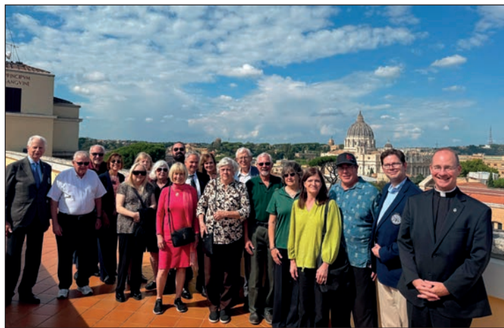
Visita del Board di S.I. al Collegio Americano a Roma

La vocazione del Serra – una vocazione all'interno