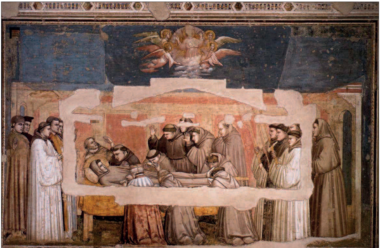
Opera di Giotto Transito di San Francesco

E l'appello che noi oggi rivolgiamo agli artisti è quello di esprimere tutto il loro genio attraverso la forma e l' immagine per rendere accessibile una bellezza di verità ineffabile .